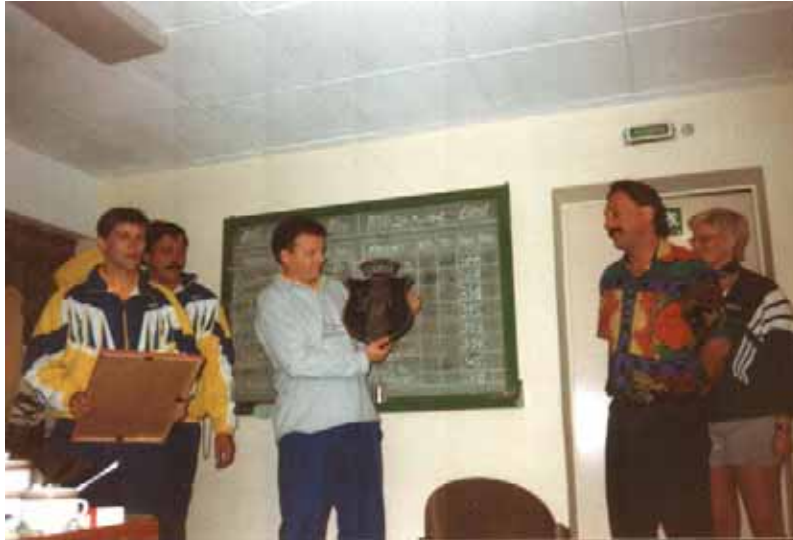
Ein Foto beider Mannschaften

Übergabe von Gastgeschenken vor dem Vergleich SKV Ronneburg gegen SSG Mariahof: